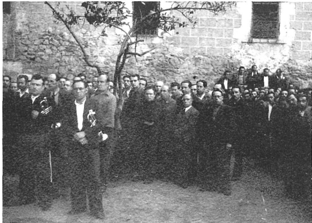
La presó de Girona, situada al seminari, arribà a albergar uns 3.000 reclusos.